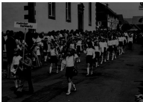
Kinderchor beim Festumzug 1973